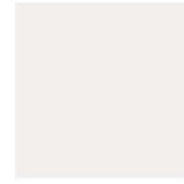
Clear P Winter 001