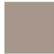
Deep P Winter 003