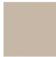
Soft P Autumn 003