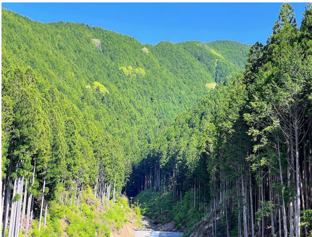
プロジェクトが実施される天川村の森林。まずは村有林でプロジェクトをスタート。約37haで実施される。

プロジェクト詳細： https://zeroco2paper.com/article/621