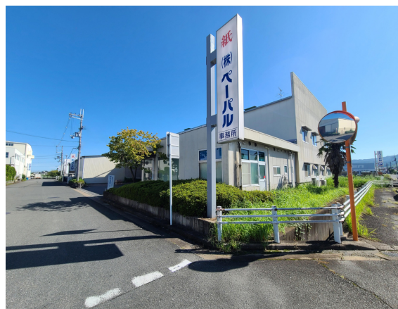
株式会社ペーパル本社

ZERO CO2 PAPER twitter : https://twitter.com/zero_co2_paper ZERO CO2 PAPER instagra : https://www.instagram.com/zero_co2_paper/