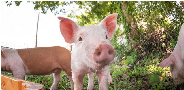
【飼育環境】愛情こめてすくすくと

尾鈴ミートでは、養豚の一貫生産に取り組み、生協などを中心に年間約 9,000 頭を出荷している。2010 年の口蹄疫で全頭殺処分のおち、それ以前の規模まで回復。現在、豚舎の施設整備を進めており、5 年後には約 25,000 頭に増える計画であり、増える生産頭数の販路づくりの一環として、新たなブランド「いとし豚」を立ち上げ、インターネット通販を含む直販事業に注力する。