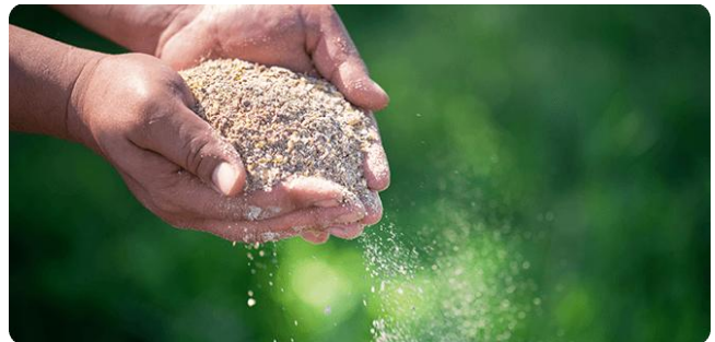
【飼料】健康への想いをこめました