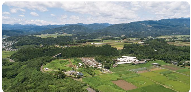
【守り伝えたい想い】「農の風景」を次世代へ