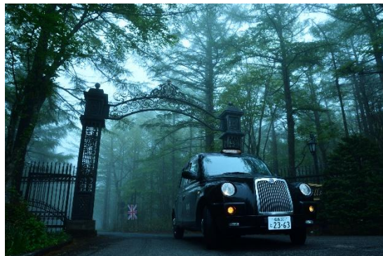
▲ スコットランド高地に似た冷涼な気候