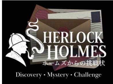
▲ 「シャーロック・ホームズ」題材の謎解き