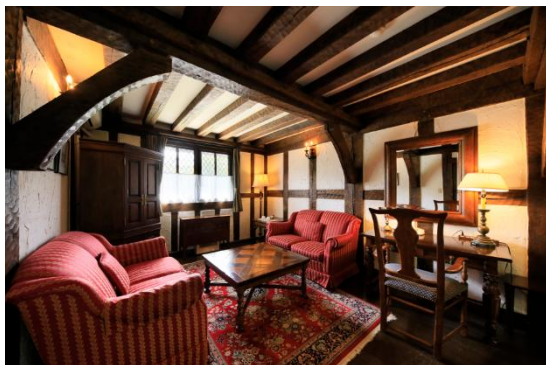
▲ 客室(写真はラグジュアリースイート)

スコットランドのハイランド地方に近い風土を持つブリティッシュヒルズは、夏は避暑地として過ごしやすく、朝晩に出る霧は一層イギリスらしい雰囲気を出します。客室は英国製のアンティーク家具を設え、日本にすることを忘れる寛ぎの空間を演出。「海外旅行の非日常感」と「国内旅行の手軽さ・安心感」を同時に満たす、夏旅をご提供いたします。