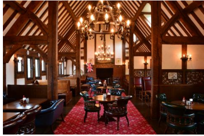
▲フォルスタッフパブ会場