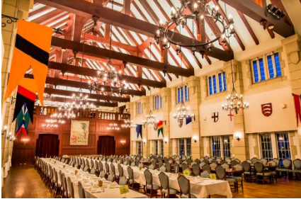
▲リファクトリー会場