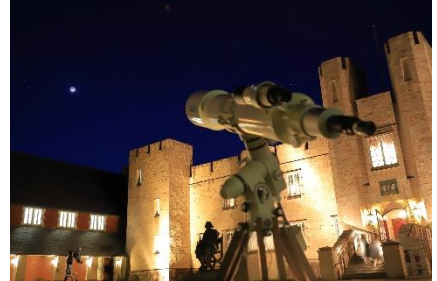
▲宿泊者限定特典「星空観察会」