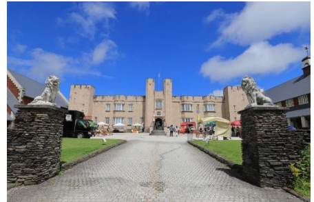
▲ ブリティッシュヒルズマーケット