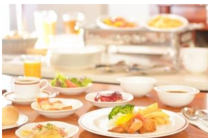
▲ブッフェブレイクファスト

スクランブルエッグやサラダ、パン、ソーセージ、ヨーグルト、フルーツなどさまざまな種類のお食事を用意しております。好きなメニューをお好きな量でお召し上がりください。感染症拡大予防対策を施しながら、ブッフェスタイルで提供いたします。