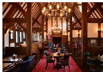
▲フォルスタッフパブ