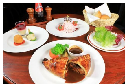
▲パブシーズナルディナー