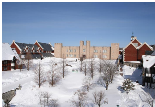
▲冬のブリティッシュヒルズ

【プラン予約】 https://www7.489pro.com/asp/489/menu.asp?id=07000028&ty=lim&plan=55&lan=JPN