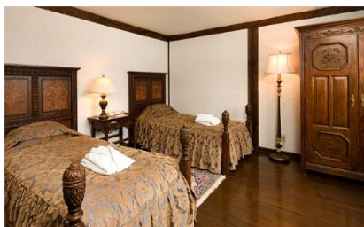
▲スタンダードルーム

木造と漆喰を基調とした安らぎの空間。英国伝統様式のバスルーム(クラシックな猫脚のバスタブ)、凝った装飾の洗面台をご用意しております。中世英国の優雅な雰囲気の中で、ゆったりとした時間をお楽しみいただけます。