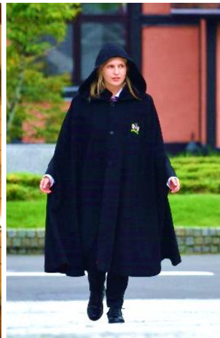
▲オリジナルマント