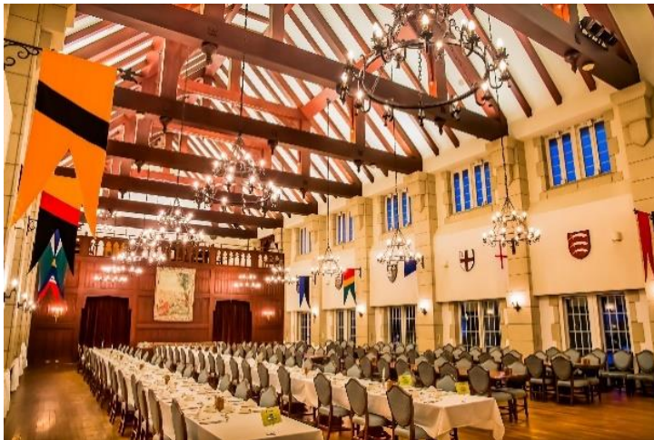
▲リフェクトリー(朝食会場)

ディナーは英国の居酒屋を再現したフォルスタッフパブでご用意。朝食は、高い吹き抜け天井が特徴の重厚感のあるリフェクトリーで、魔法学校の食堂で食事をするような体験をご提供いたします。