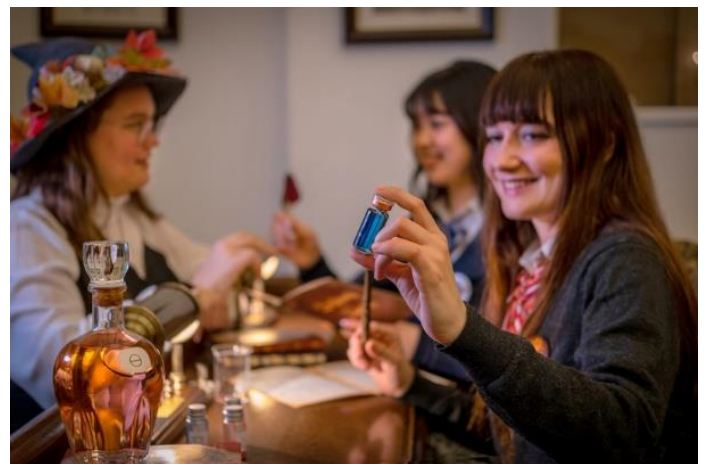
▲レッスンイメージ