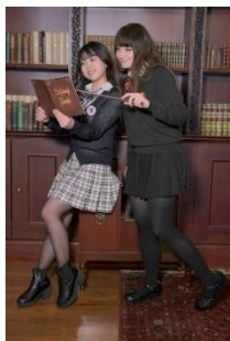
▲Year Book Photo