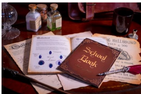
▲School of Magic Story

「#bhsomyearbook」をつけて投稿すれば、School of Magic の卒業アルバムとして魔法学校での学校生活を振り返ることができます。