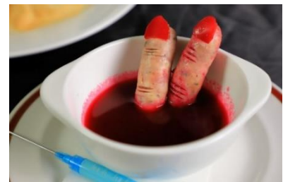
▲ 生き血と指 ビーツのスープ