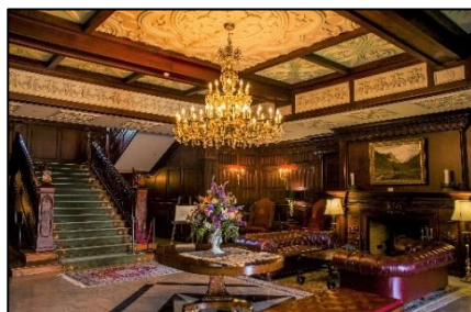
▲ 昼のマナーハウス