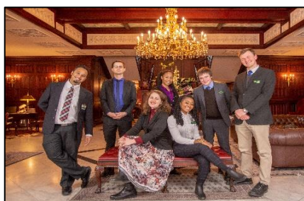
▲ ブリティッシュヒルズのティーチャー