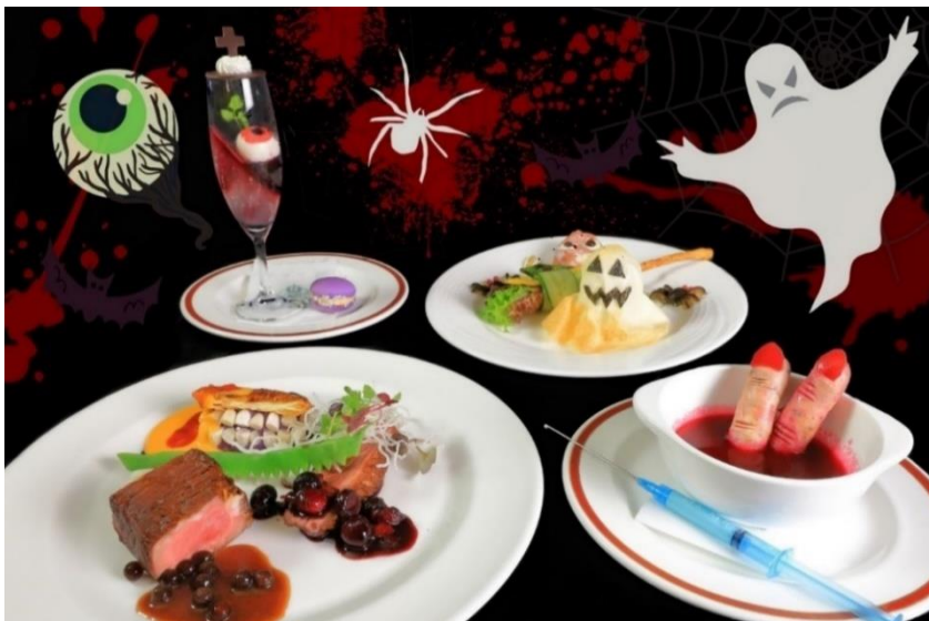
▲ ハロウィンナイト・ステイプラン「魔女の料理」

福島県天栄村にある宿泊施設兼国際研修センターのブリティッシュヒルズ(総面積 73,000 坪 運営:神田外語グループ)は、2021年10月30日(土)~31日(日)に毎年人気の秋の名物「ハロウィンイベント」を開催します。常時20名以上が在籍するイングリッシュスピーカーのティーチャーとのアクティビティを通して、生きた英語とハロウィン発祥の国と言われている英国の文化を体験できます。今年は人気のスコーン作りがハロウィン仕様になって新登場。そしてハロウィン仕様の料理や夜のお化け屋敷は当館だからこそ提供可能なメニューです。海外へ行けなくても、「パスポートのいらない英国」で手軽に海外体験ができます。