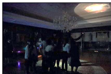
▲ ホーンテッドハウス・ホラーストーリーの様子