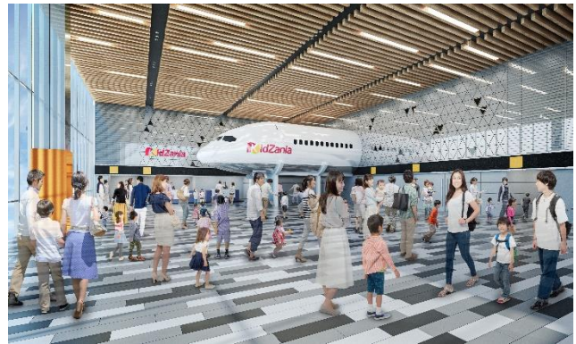
入口付近（イメージ）