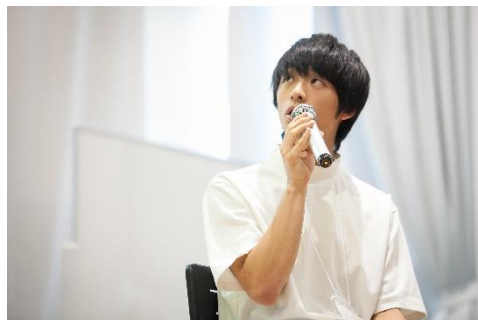
ビジネスプラン発表会の様子（イメージ）