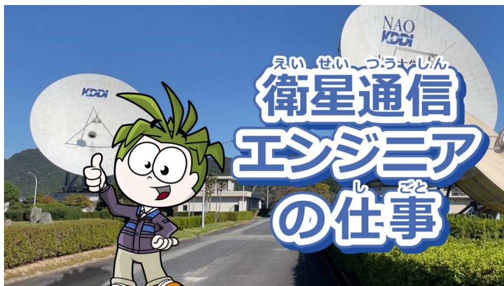
<「衛星通信エンジニア」のコンテンツイメージ>

なお、本コンテンツの内容は、今後順次追加予定です（注）。追加コンテンツとして、2023年2月9日以降はシミュレーターを使って仕事に必要なスキルを学ぶことができる「トレーニング」をお楽しみいただけるようになります。また、2023年3月12日に、現場で働く衛星通信のプロフェッショナルに直接質問ができる「ワークショップ」を開催予定です。