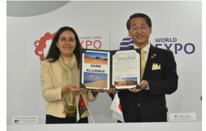
ヨルダン館との締結（令和7年4月23日）

ヨルダン館、サウジアラビア王国館、ナウルパビリオン、アルジェリアパビリオン、欧州連合（EU）パビリオン、モザンビーク共和国パビリオン、モーリタニア・イスラム共和国パビリオン、関西パビリオン鳥取県ゾーン