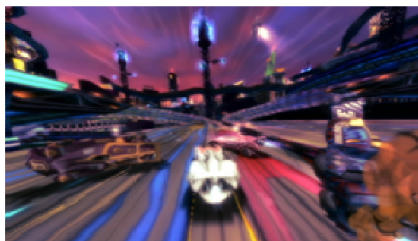
<ゲームイメージ:Wii版>