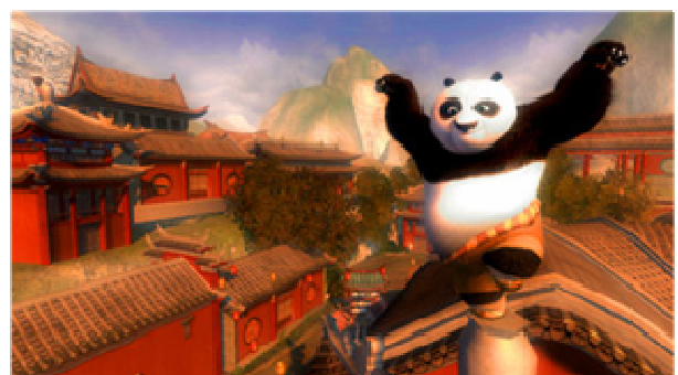
<ゲームイメージ: プレイステーション3版 /Wii版>