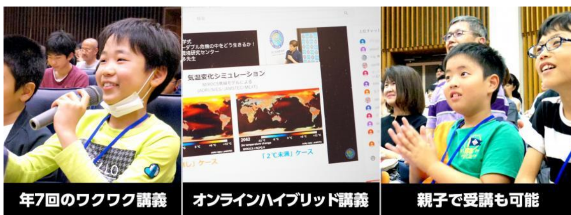
年7回のワクワク講義

子ども大学グローバルはミネルバ大学方式。基本は「オンラインキャンパス」ですが、毎回、ライブ配信会場を現地キャンパスとし、「水戸キャンパス」「つくばキャンパス」「東京キャンパス」など、希望者はライブ配信会場での現地受講も可能です。※希望者多数の場合は抽選となります。