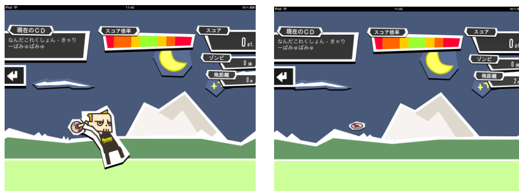
画面をなぞってCDを飛ばせ！