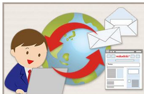
ビジネスで活かせるインターネット・メールを学習