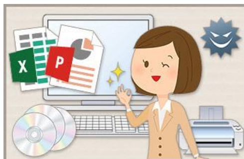
パソコンの活用方法を学習！「IT リテラシー」が高まる