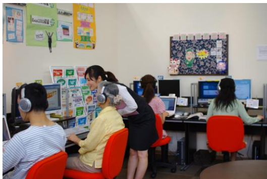
パソコン教室わかるとできるの授業風景

株式会社わかるとできる（代表取締役：碓弘一（さこひろかず）、本社：東京都渋谷区、以下わかるとできる）が、全国の「パソコン教室わかるとできる」にて 2013 年 5 月に開講した「iPad 講座」の受講者数が 1,000 名を突破しました。お客様の多くの声にお応えし、来年初頭には 2013 年 9 月 18 日にリリースされる iOS7 に対応した講座を開講いたします。9 月 20 日に販売が開始される iPhone5S・iPhone5C での受講が可能です。