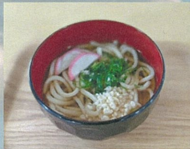
あすなろうどん 400円