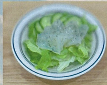
日替わりサラダ 100円