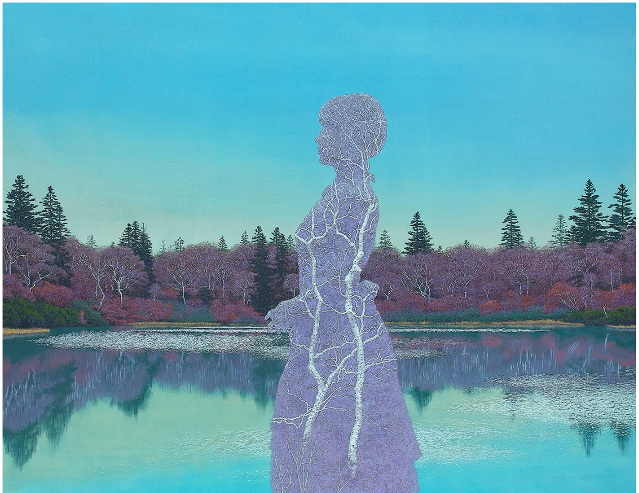
Memory 50-2, 2021, 90.9 × 116.7cm

この度、ホワイトストーンギャラリー銀座新館とオンラインギャラリーでは、 二川和之による個展『地球は人間がいなくても困らない』を開催いたします。