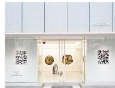
GINZA NEW GALLERY