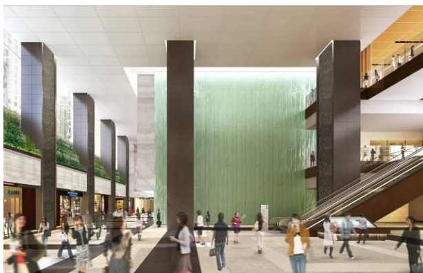
Ⅱ期開業時イメージ