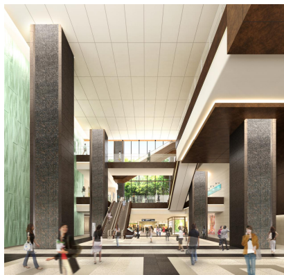
地下プラザイメージ

商業ゾーン「OOTEMORI（オーテモリ）」は、施設内に東京メトロ東西線と丸ノ内線の連絡通路を有すなど、地下鉄5路線が乗り入れる大手町駅地下ネットワークの中心に位置する利便性の高い立地環境に加え、高さ15mの吹抜け空間を通じ地上の「大手町の森」からの自然光が差し込む、地下とは思えない森の中にあるような安らぎを感じていただける施設環境を整備し、周辺エリアで働く方々にオン・オフの利用シーンを問わず便利で憩える場を提供いたします。