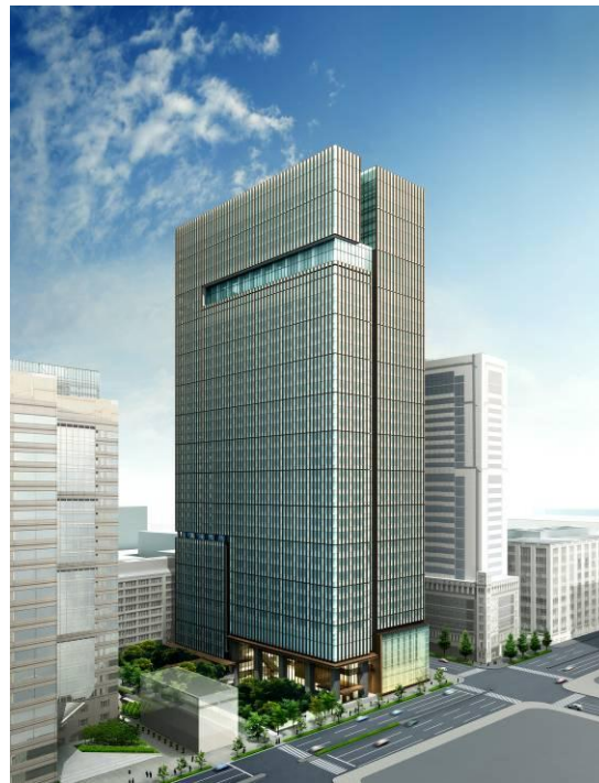
大手町タワー外観イメージ