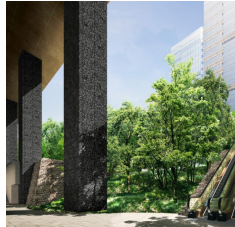
大手町の森イメージ(地下1階より)