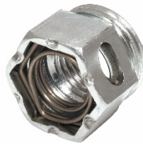
スマートインサートナット