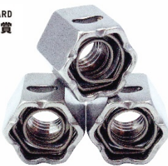
スマートハイパーロードナット