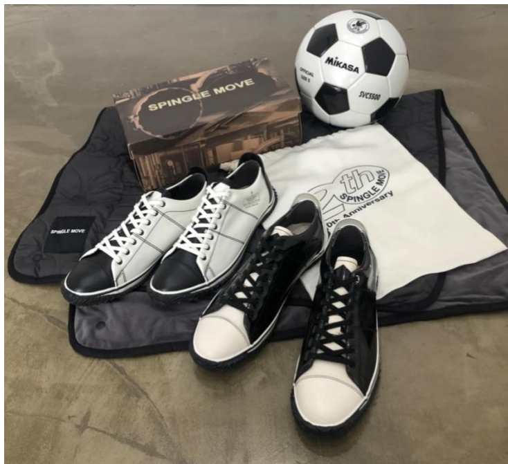
SPINGLE MOVE 「SPM-1019」