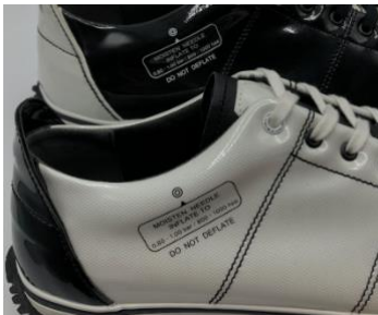
空気穴のレギュレーションを模したデザイン