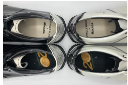
左右非対称のインソールデザイン