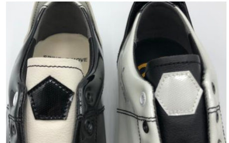
サッカーボールを構成する五角形と六角形のマーク