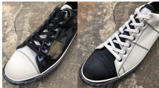
サッカーボール素材とカンガルーレザーのコンビ