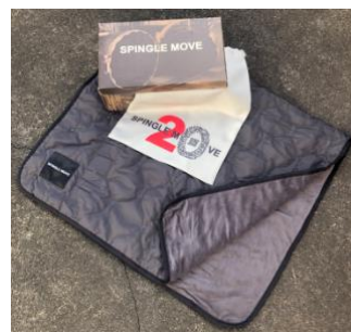
専用スペシャルボックスと特製シューズバッグ、キルティングブランケット兼ポンチョ

SPINGLE MOVE の 20 周年記念モデルは、広島県府中市の本社工場にあるバルカナイズ製法の釜をプリントした専用スペシャルボックスに入っています。さらに、今回は特製シューズバッグ、サッカー観戦など野外で活躍するキルティングのブランケット(兼ポンチョ)がついています。