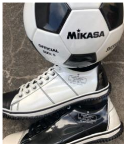
サッカーボール素材を採用

インソールの片足はアイボリーベースに「SPINGLE MOVE x MIKASA」のプリント、もう片足はブラックベースに20周年記念ロゴをプリントしています。