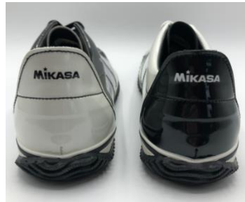
カカトには MIKASA のロゴマーク