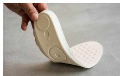
天然ラテックス製カップインソール

2022年冬モデルから投入した「天然ラテックス製カップインソール」は、土踏まずを考慮し足のアーチを保つ設計により、高いフィット感を実現しているほか、踵部分に厚みを持たせることでクッション性を高め、歩行時の疲労を軽減します。加えて通気性、透湿性にも優れ、内部を快適な状態に保ちます。