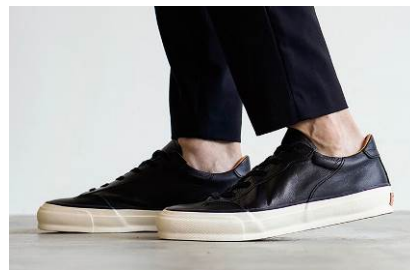
履き口にクッションを入れ優しい足なりに