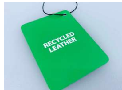
リサイクルレザーのタグが付く