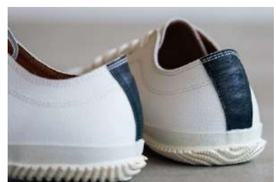
踵飾りはダークブルーのカンガルーレザー