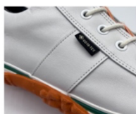
サイドラインレザー

・サイドラインのレザーはデザインとしての要素と、二重の革で横に伸びるのを最小限に抑えつつ、足をホールドさせる役割があります。アウトソールはスピンクル独自のトレッドパターンを開発しました。スパイクレスながら芝を捉えつつ、表面の凹凸でカート道などのフラットな場所でも滑りにくい新しいパターンです。また、スピンクルの特徴である巻き上げソールにより、つま先部はスイングのフォロースルーの際の安定性を高めます。踵部はドライビングシューズの役割も果たし、ゴルフ場の行き帰りの運転をサポートします。さらに、バルカナイズ製法で作ったアウトソールは抗菌仕様のため、ゴルフ場への雑菌の持ち込みを防ぐことができます。