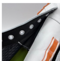
シュータンに水かき付