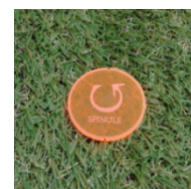
オリジナル蛍光マーカー