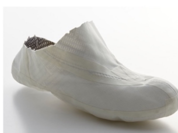
GORE-TEXファブリクス (イメージ)

新商品は、朝露で濡れたゴルフコースでも快適なプレーを約束するために水を浸入させず、汗の水蒸気を発散させる機能を持つ GORE-TEX ファブリクスを靴の中に組み込んでいます。GORE-TEX ファブリクスは、その内部に水は通さず水蒸気は通す微細な孔を無数に持つ GORE-TEX メンブレンという膜を備えており、高い防水透湿機能を発揮します。