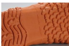
新開発のトレッドパターン