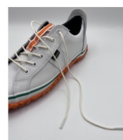
撥水加工されたシューレース