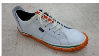
旧ロゴをイメージした配色