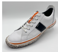
ホワイト/ブラック