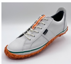
ホワイト/オレンジ