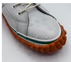
GORE-TEXフットウェア仕様のレザー