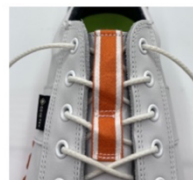
ストライプテープ