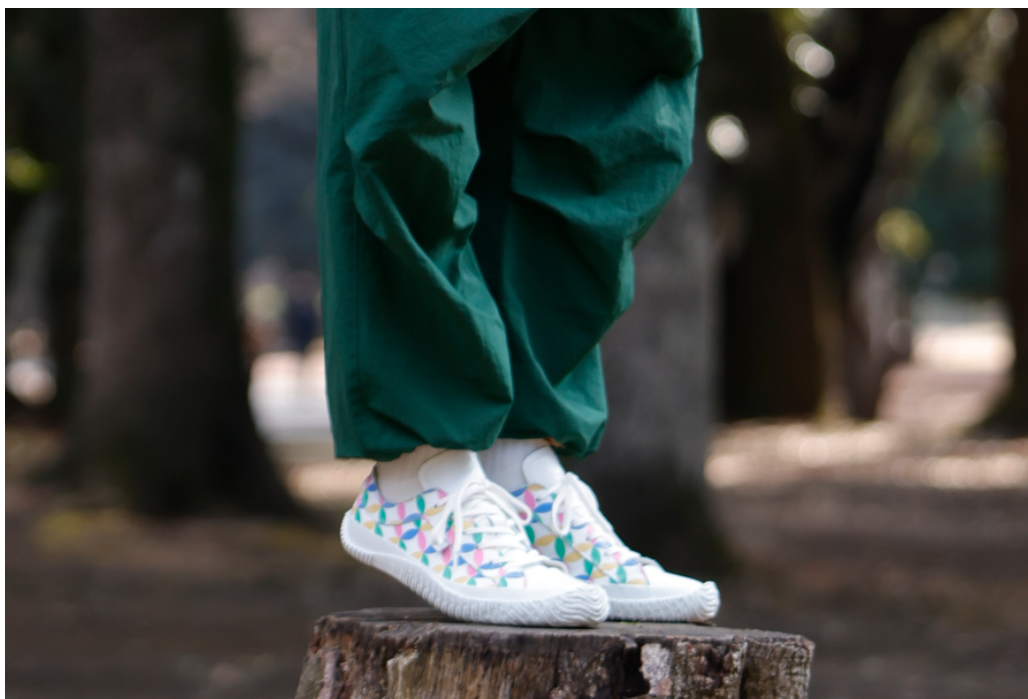
レースアップシューズ「SP-1051」

株式会社スピングルカンパニー（本社：広島県府中市、代表取締役社長：内田貴久）は、SPINGLEの2025年シーズンテーマ「Circle」をイメージしたオリジナルの七宝柄のレザーシューズとして、レースアップタイプの「SP-1051」を3月7日（金）から、スリッポンタイプの「SP-1052」を4月から、全国のSPINGLE専門店、国内外シューズショップ、SPINGLE公式オンラインストアにて順次発売します。