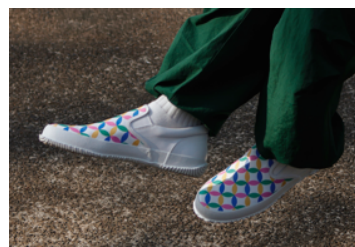
スリッポンシューズ「SP-1052」

七宝柄は、円形が永遠に連鎖しつながることで「円満」や「調和」、「ご縁」などの願いが込められた縁起の良い柄といわれています。人との「ご縁」やつながりは七宝（仏教の経典に出てくる七種の宝）と同等の価値があり、SPINGLEとユーザーが商品を通してつながることを表現するにあたり、最もイメージに合った柄として採用しました。今回の新作に採用したオリジナルの七宝柄レザーは、人が共通して頭に思い描く色である心理4原色（赤、黄、緑、青）を「皆にゆかりのある色」ととらえ、ポップな色調で牛革にプリントしています。