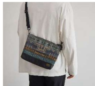
内ポケットが3つ付く。うち1つは、ファスナー付きで、機能面も充実

○商品紹介ページ： https://www.spingle.jp/blog/pendleton/ ※発売日以降に公開します。