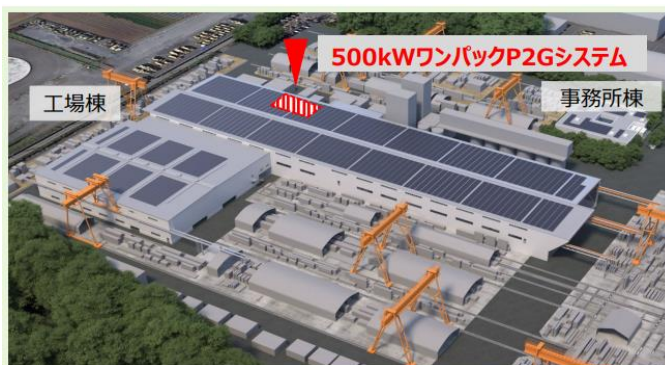
【大成ユーレック川越工場全景】