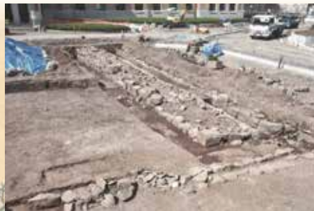
山梨県庁で見つかった石垣