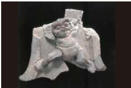
発掘された金箔鬼瓦

江戸時代から昭和時代まで(ガラス乾板や絵はがきなども含む) 甲府城跡の遠景写真・近景写真、堀・石垣など甲府城跡の一部が写る写真