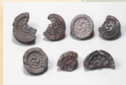
発掘された江戸時代の瓦