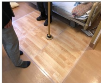
マットタイプ (置くだけ)