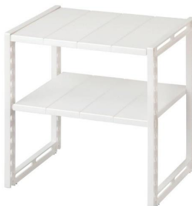
洗面台下収納ラック