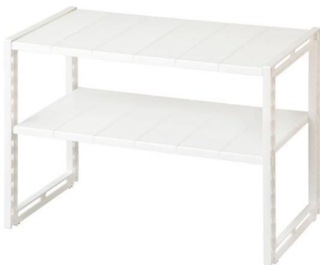
シンク下収納ラック