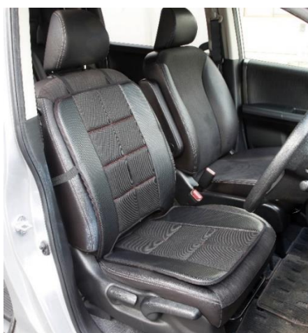
サポートダブルクッション