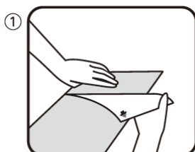
① 吸着面のシートフィルムを剥がします。

「吸着フロアシート」の施工方法は、裏面のシートフィルムを剥がすだけ。カッターで必要なサイズにカットが可能で、スペースに合わせてご利用いただけます。床の色味やデザインを簡単に自分好みにアレンジしていただけます。