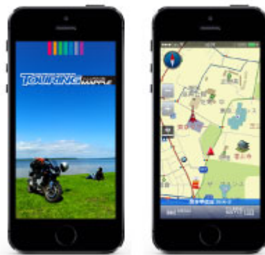
&lt;「ツーリングマップルと使うナビ」&gt;

『ツーリングマップル』シリーズはバイクでのツーリングに役立つ情報が詰まった道路地図で、30年近く続くロングセラー商品です。見やすさにこだわったロードマップ上には、道路、宿泊・休憩施設、絶景ポイント、温泉、ご当地グルメ、穴場スポットなど、ライダー好みのきめ細やかな情報が盛り込まれています。また、景観がすばらしいおすすめルートや混雑を避ける抜け道ルートも収録。日帰りから数日間にわたるロングツーリングにもご利用いただける一冊です。