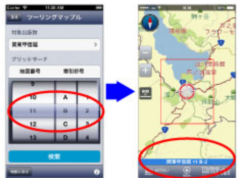
<グリッドサーチ機能>

当アプリに、誌面のページ番号と索引符号を入力すれば、その場所の地図画面へジャンプでき、目的地を簡単に設定できます。また、目的地のほかに経由地を5箇所まで登録できるので、立ち寄りしたいポイントを含めたツーリングプランを設定することができます。