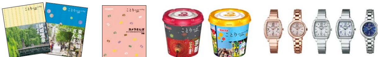
〈タイアップ・コラボレーション例〉

『ことりっふ』が旅好きな女性に浸透していることは自治体や企業からも注目され、各地域の女性誘客やターゲット層へのプロモーションに「ことりっふ」ブランドを活用いただいております。これまで自治体や交通機関などによる数多くのタイアップ出版や小冊子が発行され、更には「ことりっふ時計」「ことりっふスープ」といったコラボレーションも続々実現しています。