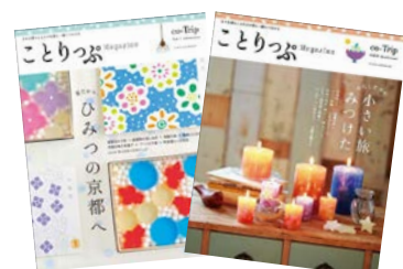
〈ことりっぷマガジン〉

【リリースに関する問い合わせ】株式会社 昭文社 経営企画室 広報担当 竹内 和田