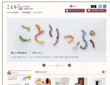
〈ことりっふお取り寄せ〉

これからも『ことりっふ』は皆様の心地よい旅と暮らしを、また地域や企業と女性を結ぶお手伝いをしてまいります。