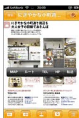
〈ことりっぷアプリ〉