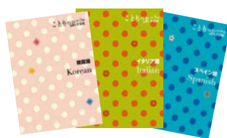
〈ことりっぷ会話帖〉