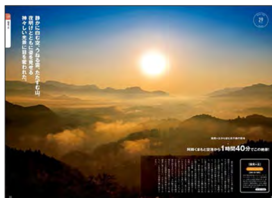
<「国見ヶ丘から望む高千穂の雲海」>