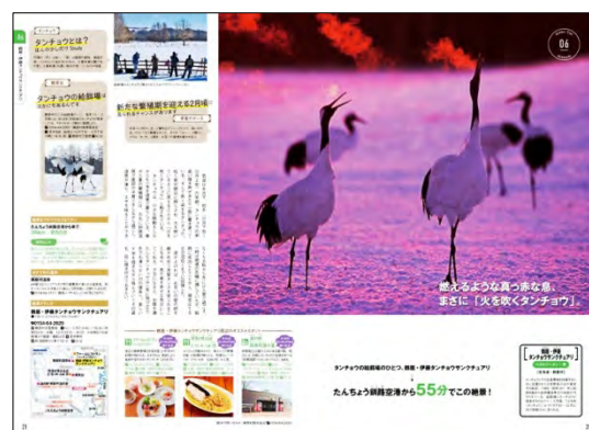
<「鶴居・伊藤タンチョウサンクチュアリ」>