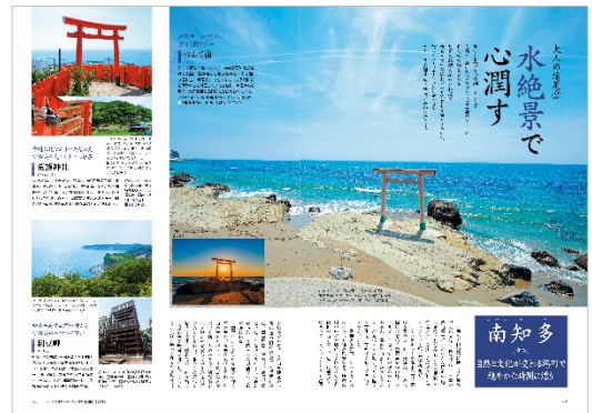
<大人の遠足 南知多>