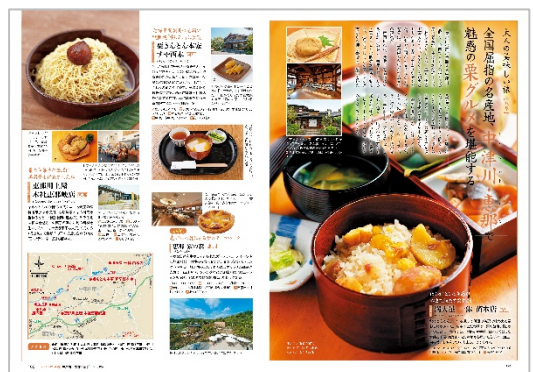
<中津川・恵那×栗グルメ>