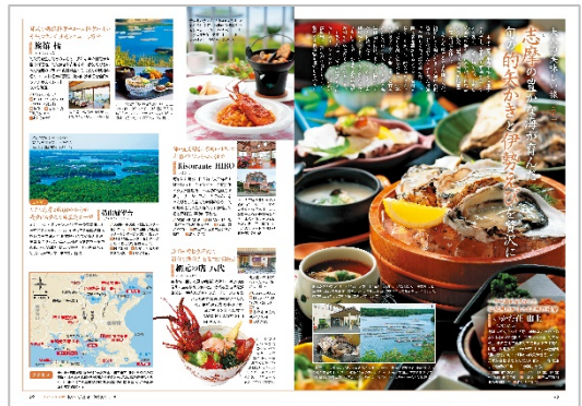
<志摩×的矢かきと伊勢えび>