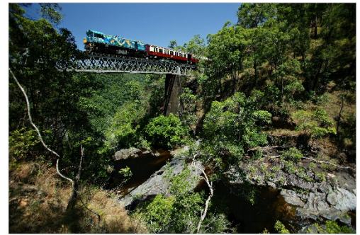
<キュランダ鉄道のツアー例>

ケアンズから熱帯雨林の上空を移動する「スカイレール」と歴史ある「キュランダ鉄道（キュランダ高原列車）」に乗ってキュランダへ。キュランダ村では自由に散策が楽しめます。