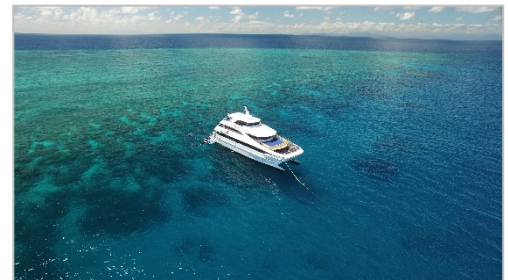
<アウターリーフのツアー例>

グレートバリアリーフを本格的に体験するためのツアー。アウターリーフの人気2スポットでたっぷり5時間、シュノーケリングを楽しめるクルーズです。最新鋭のクルーズボートで快適な船旅を。