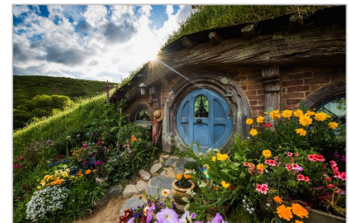
<ロード・オブ・ザ・リングのツアー例>

名作『ロード・オブ・ザ・リング』の撮影地ツアーで、ホビット気分を満喫！土ボタルで有名なワイトモ洞窟やロトルアなど、ニュージーランドの自然美を堪能できる名所訪問も。