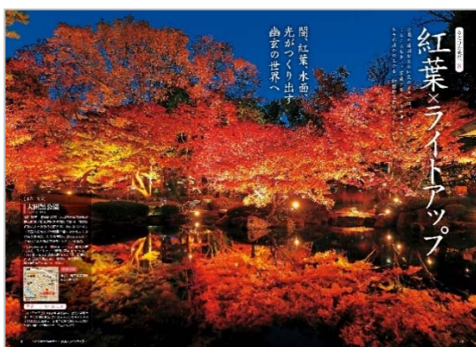
<「紅葉×ライトアップ」ページ例>

第二特集は「秋色に染まるあの街へ 大人の紅葉旅」。グラビア感あふれる紅葉写真に加え、食べる、買う、といった立ち寄り情報も紹介、大人の日帰り旅をしっかりサポートします。