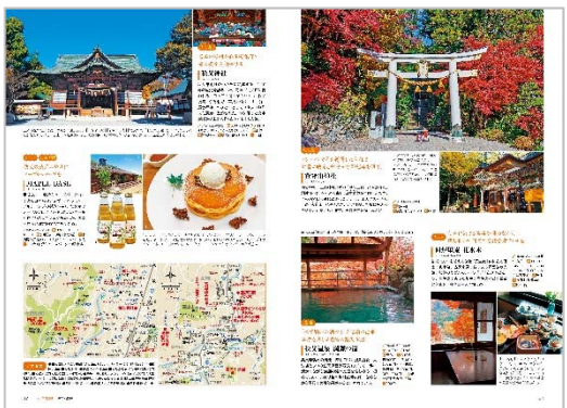
<「大人の紅葉旅」ページ例>