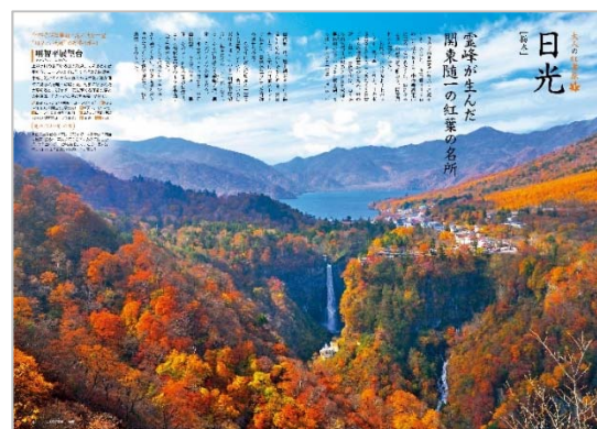
<「大人の紅葉旅」ページ例>