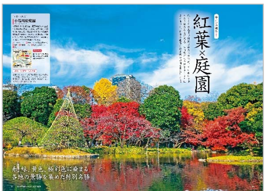
<「紅葉×庭園」ページ例>