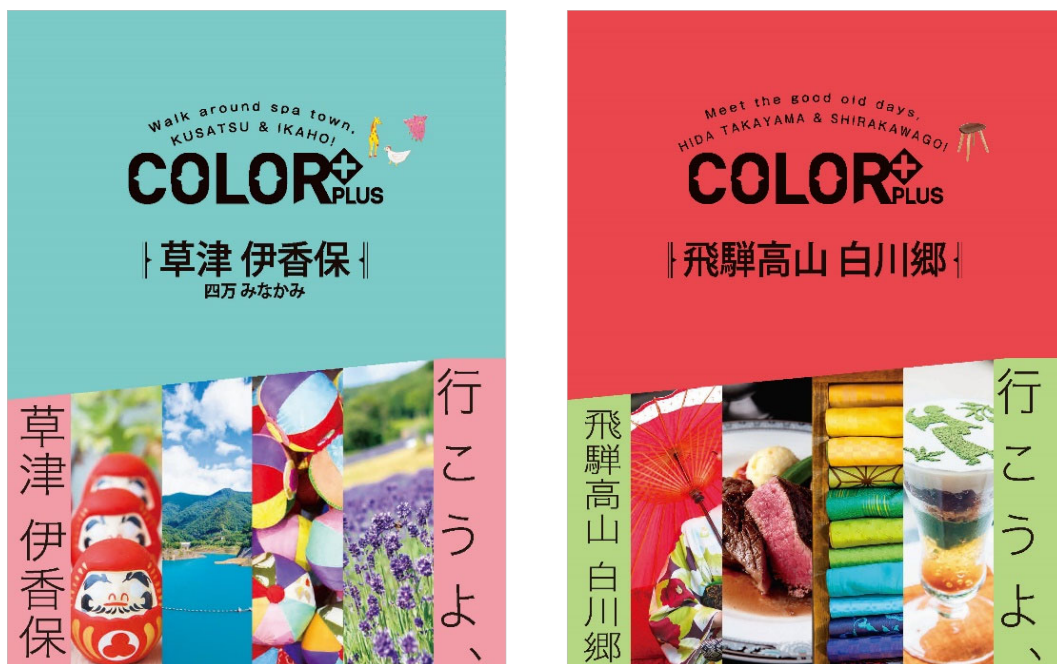
＜「草津 伊香保 四万 みなかみ」、「飛騨高山 白川郷」の表紙＞

※ 各書店の店頭に入荷する時期は前後する場合がございます。入荷日については各書店へお問い合わせください。