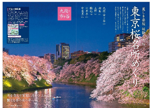
<「東京桜名所めぐり」ページ例>