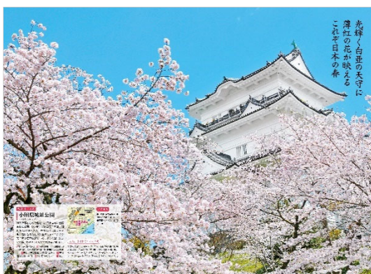
<「城址の桜」ページ例>

ほか、特集は「麗しき昼桜 妖艶な夜桜 東京桜名所めぐり」「春色に染まるあの街へ 大人の桜旅」の2つをご用意。グラビア感あふれる桜写真に加え、食べる、買う、といった立ち寄り情報もご紹介することで、この春の大人の日帰り旅の魅力が倍増する一冊に仕上げました。