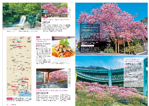
<「大人の桜旅」ページ例>