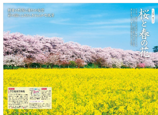
<「桜と春の花」ページ例>