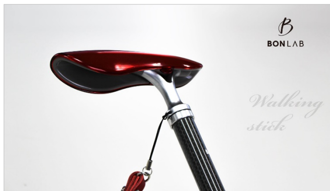
<左：「KINGGEAR」、右：「BONLAB」の製品イメージ>