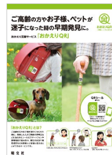
<「おかえり QR」取扱説明書>

この2月からはオンライン販売も開始し、更には見守りや迷子保護を専門とされる方々、関係団体、企業へのサービスの認知拡大にも努め、ご家族の方に安心をお届けすべく、日夜取り組んでおります。