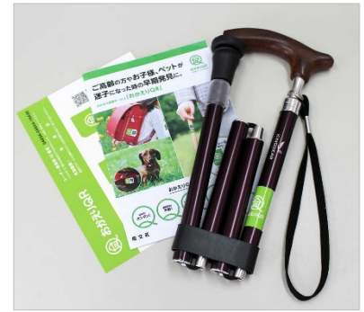
<「おかえりQR」シール例>