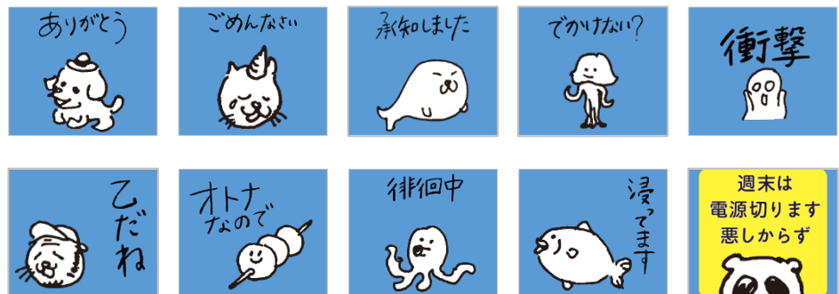
<主なスタンプ例（10種）>