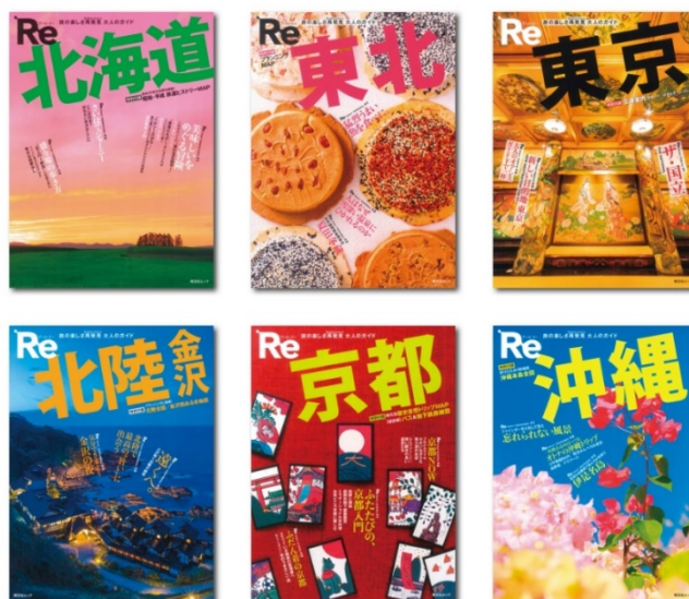
<既刊6点の表紙画像>

商品名 : 『Re』(アール・イー)「北海道」「東北」「東京」「北陸 金沢」「京都」「沖縄」 体裁・頁数 : B5 変判 (H245×W182)、本体 144~160 頁 発売日 : 2019年6月6日 全国の主要書店で販売 定価 : 1,000円+税 出版社 : 株式会社 昭文社