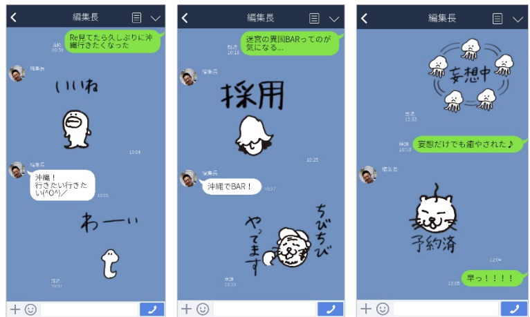
<スタンプを使った会話イメージ>

商品名 : 「Re 特派員の旅支度」 提供開始日 : 2019年9月18日 ※下記 URL より購入可能 || LINE STORE ⇒ https://line.me/S/sticker/8714735 定価 : 利用料金 : 50LINE コイン ※120円 (税込) スタンプ个数 40個 発売元 : 株式会社 昭文社