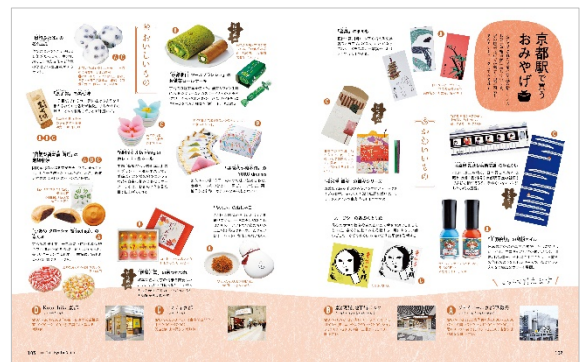
<「京都駅で買うおみやげ」>