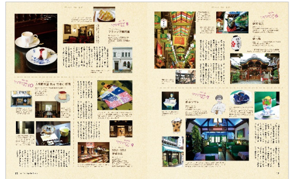
<「三条・河原町」紹介ページ例>

商品名 : 『ことりっぷマガジン特別編集 京都だより』 体裁・頁数 : B5 変判、112 頁 発売日 : 2019年10月7日 全国の主要書店で販売 定価 : 900円+税 出版社 : 株式会社 昭文社