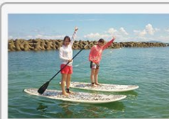
SUP&海辺の絶景バイキング 1人あたり 30,000円 福岡県岡垣町