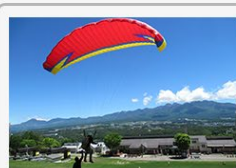
パラグライダー半日体験 1人あたり 23,000円 長野県富士見町