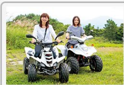
バギーに乗って化石掘り 1人あたり 46,700円 京都府宮津市