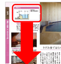
<予約前のチェックポイント>