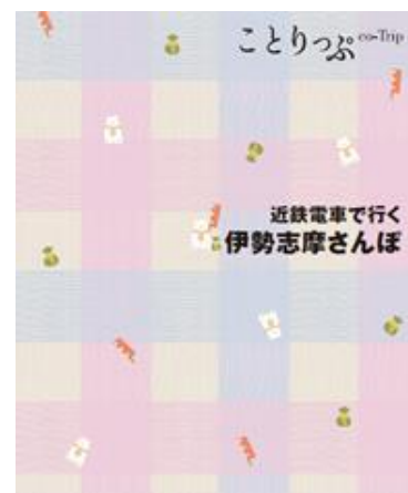
「ことりっぷ 近鉄電車で行く伊勢志摩さんぽ」 表紙(イメージ)