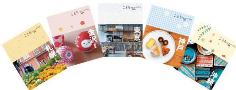
ことりっぷ WEB サイト、ガイドブック(イメージ)