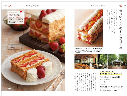
< 「東京いちごケーキ」 >

1 いちご本の使い方 | 2 東京ストロベリーパークに行ってみました | 3 かわいすぎるいちご雑貨 4 個性いろいろいちごドリンク | 5 いちご×ジャムは Teppan