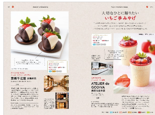
< 「いちご手みやげ」 >