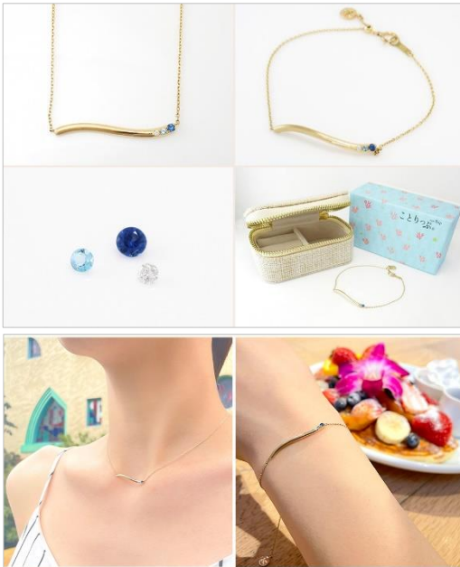
<「ニューカレドニア～波のきらめき～」 商品画像>