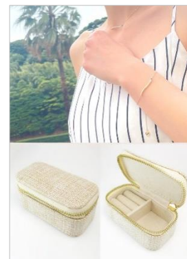
<「旅するジュエリー」イメージ画像>

|| 小さくて軽い! オリジナルトラベルジュエリーケース付き: 旅好きな女性のために、手のひらサイズで軽さを重視した、ミニトラベルジュエリーケースを全商品にプレゼントとして付けています。夏らしい涼しげな麻素材でリングもピアスも収納できます。従来のジュエリーボックスよりコンパクトかつ軽量、ありそうでなかった、旅行にはもってこいの優れモノです。