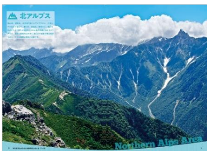
<「北アルプス」代表誌面>

2015年出版の『日本百名山トレッキングコースガイド』の全面改訂版として登場する本書は、北海道、東北、上信越、北関東、秩父・南関東の53座を上巻、北アルプス、中央アルプス、南アルプス、八ヶ岳、近畿・北陸、中国・四国、九州の47座を下巻にて紹介しています。