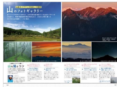
<「山のフォトギャラリー」代表誌面>