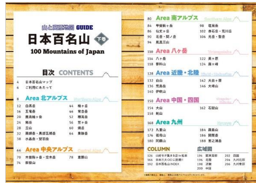
<目次(左:上巻、右:下巻)>