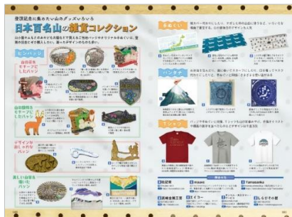
<「日本百名山の雑貨コレクション」代表誌面>

ガイド&地図ページ以外にも、日本百名山にまつわるお楽しみコラムが満載です。上巻では 百名山コンプリートプラン 、山小屋などで入手可能な 日本百名山の雑貨コレクション 、山岳カメラマンが会った絶景と写真撮影のコツをまとめた 山のフォトギャラリー 、下巻では 岳都・松本にある山好きが集まる店 、行きたい山がすぐに見つかる 日本百名山 INDEX など、山好きにはたまらない、読んでいて楽しくなるページもご用意しました。