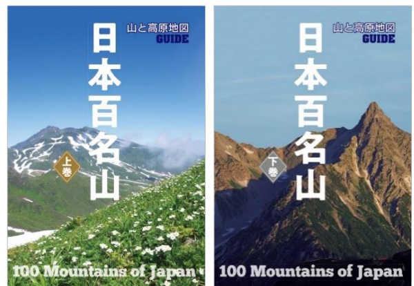
<表紙(左:上巻、右:下巻)>

「初心者、経験者問わず、山を語るときの共通の話題である日本百名山の情報を全山収録しました。誌面を通して、日本百名山の魅力を存分に楽しみながら、自分のレベルに合った登山にチャレンジしていただければ、と思います」