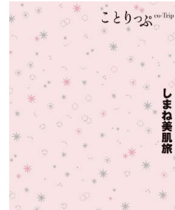
<「しまね美肌旅」冊子表紙>

巻頭には 16P のオリジナル小冊子「しまね美肌旅」を掲載しています。気象条件に恵まれ、温泉が多く、美肌食材も豊富な「美肌県しまね」にて見つけた、美肌のヒントが詰まったさまざまな場所や体験、食材を、ことりっぷならではのセレクトでたっぷりお届けします。