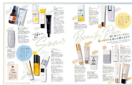
<「Summer Beauty Plan」ページ例>