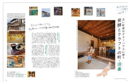
<「すてきな人がいる町に」ページ例>

ほか、今回鞍馬口通をご案内する「京都よりみちこみち」、「東京さんぽ」は新しい発見のある自由が丘などの人気連載も内容盛りだくさん、ご満足いただける内容に仕上げました。