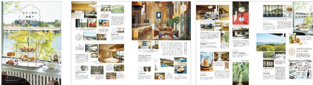
<「ひとり旅の京都でしたいこと」ページ例>

まだ気軽に友人とおでかけしにくいこの夏、「ひとり旅の京都でしたいこと」をテーマに、話題のホテルでステイ、自然豊かな嵐山をのんびり散策、京都御所周辺でカフェ・ショップめぐり、一人でも気軽に入れる京中華とカウンターのある店、京都生まれのモノを買うなど、週末にふらりとひとり旅したくなる京都をご紹介します。