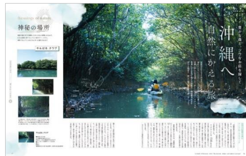
<「沖縄へ 自然にかえる」ページ例>

【リリースに関するお問合せ】 株式会社 昭文社ホールディングス 広報担当: 竹内、張