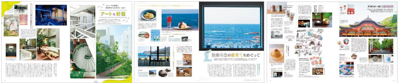
<「アートな前橋」ページ例> <「能登半島の最果てをめぐって」ページ例> <「福岡・太宰府へ」ページ例>

まだ気軽に友人とおでかけしにくいこの夏、「ひとり旅の京都でしたいこと」をテーマに、話題のホテルでステイ、自然豊かな嵐山をのんびり散策、京都御所周辺でカフェ・ショップめぐり、一人でも気軽に入れる京中華とカウンターのある店、京都生まれのモノを買うなど、週末にふらりとひとり旅したくなる京都をご紹介します。