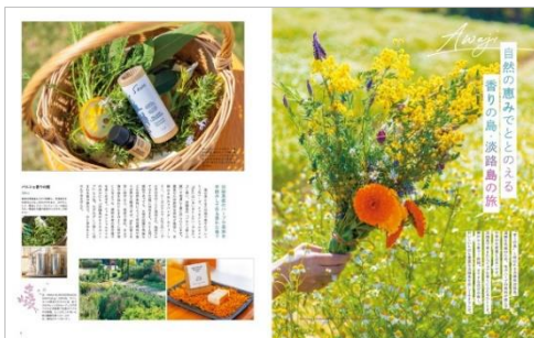
<「香りの島・淡路島の旅」ページ例>

いまの自分にチャージしたいコトやモノ、新しい気づきに出会えるかもしれない、またこれからのライフスタイルにもつながる旅先。まだまだ旅にいけない状況の中で、次の旅を思案してみるだけで何かの気づきがあるかもしれません。そのような旅の目的や理由をもった場所を巻頭特集でご紹介します。植物本来の香りでもリフレッシュしたり、お香を学ぶ香りをめぐる淡路島の旅、大自然を満喫する体験を通じて自然にかえる沖縄の旅、感性をみがく東北の旅、万葉の自然が息づく福岡・太宰府の旅等々さまざまな切り口で、自分らしい旅の楽しみ方をご提案しています。